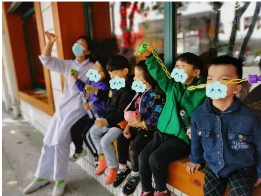
妈妈带我们去院子里吹泡泡

有时候外面天气特别好，妈妈们也会带着我们一起下楼跳房子、吹泡泡、转圈圈。我们吹起来的泡泡在阳光下闪闪的，认真看看，还有不同的颜色呢。每次下楼散步，我们都很兴奋，拉着妈妈蹦蹦跳跳的。