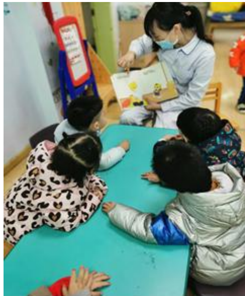
我和小伙伴们一起听妈妈讲故事

因为很多小伙伴身体状况都不是很稳定，有些人还做了手术，所以我们很少去外面的公园玩，妈妈说，只要我们乖乖养病好好吃饭，以后长大了想去哪里就能去哪里。虽然不能去看外面的世界，但是我们也很开心，因为妈妈们几乎一直陪着我们。